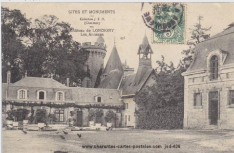
N° 436 – Château de Londigny Timbrée (date illisible) Bon état